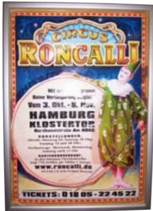
KULT! Kultur im Rahmen