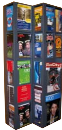
City News Hamburg City News Metropolregion City News Tourismus