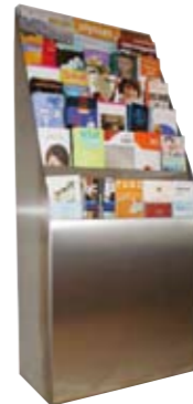
Kultur Extra Hotel (Beispiel) Kultur Extra Theaterkassen