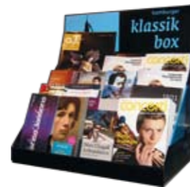
Kultur Extra Klassik