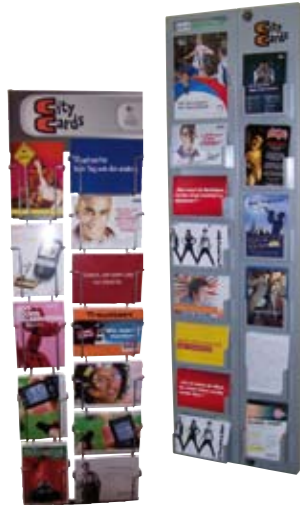
ExtraCard™ Hamburg und Metropolregion Lüneburg und Lübeck