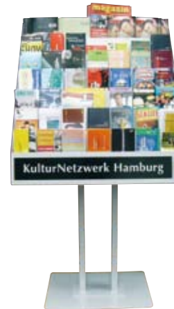
Kultur Netzwerk Nord Kultur Extra Flughafen