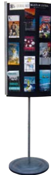
Kultur Extra Bildung und PremiumGastro